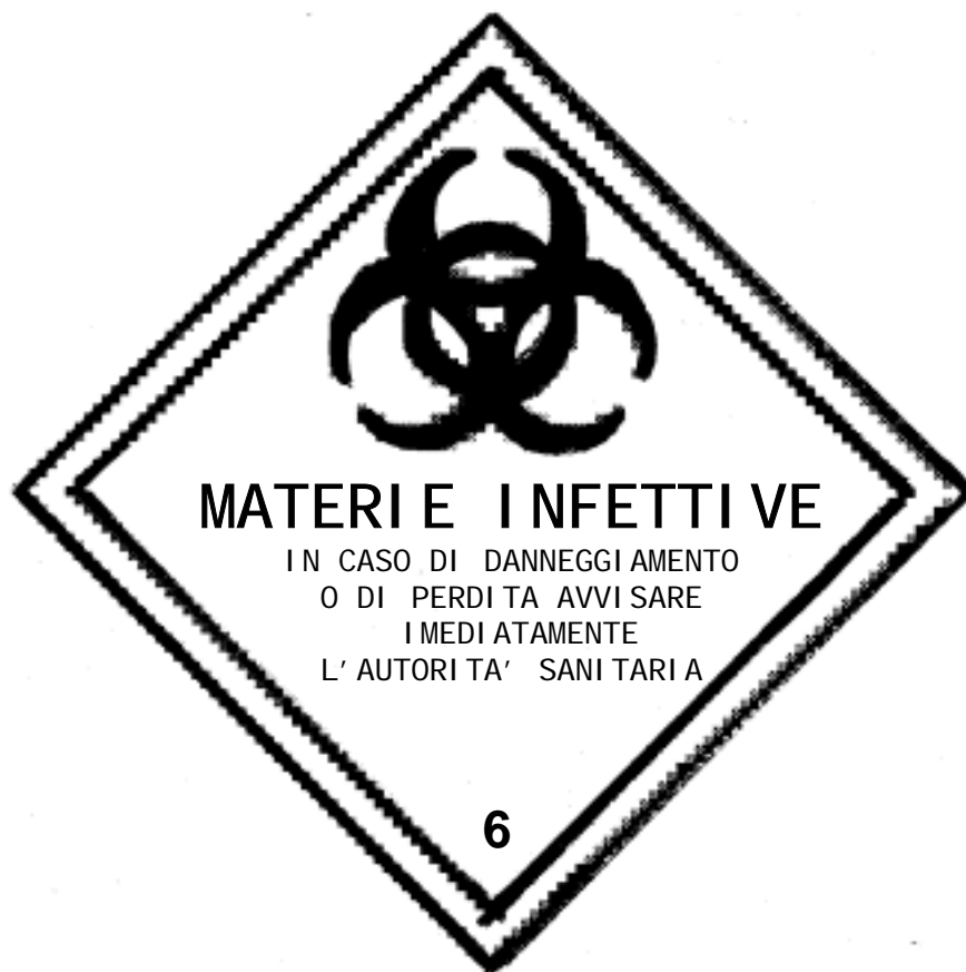
Figura 1: Etichetta di rischio per sostanze infettive